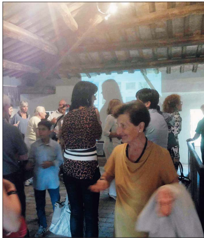
Pubblico numeroso alla mostra, a destra uno scatto in esposizione