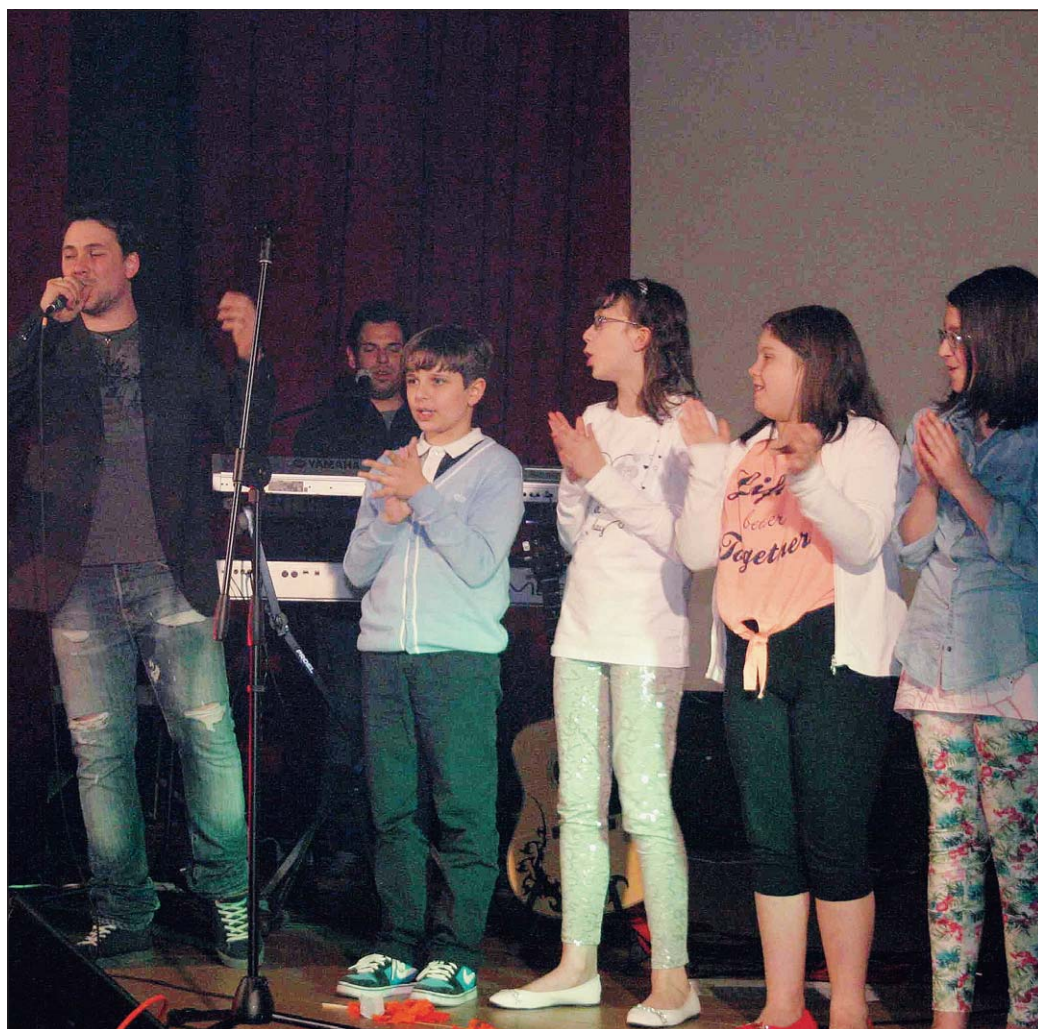
Rock e poesie al teatro di San Bortolo

La serata è stata ulteriormente arricchita dalla lettura di poesie. Hanno in-