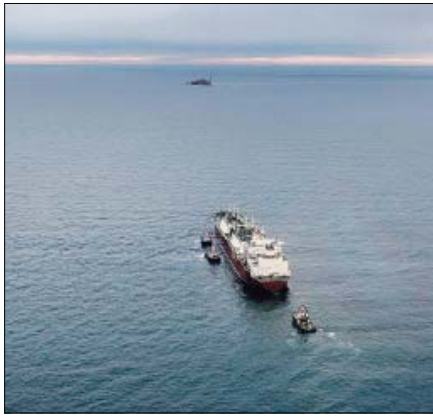
Sul mare Una suggestiva foto dell'alto del terminal di Adriatic Lng

VESCOVANA Rassegna di Adriatic Lng: iscrizioni entro il 20 agosto