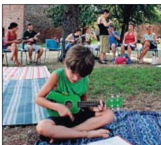
Una lezione estiva di ukulele in città

Ultima lezione dedicata all'ukulele appuntamento mercoledì al Ridotto