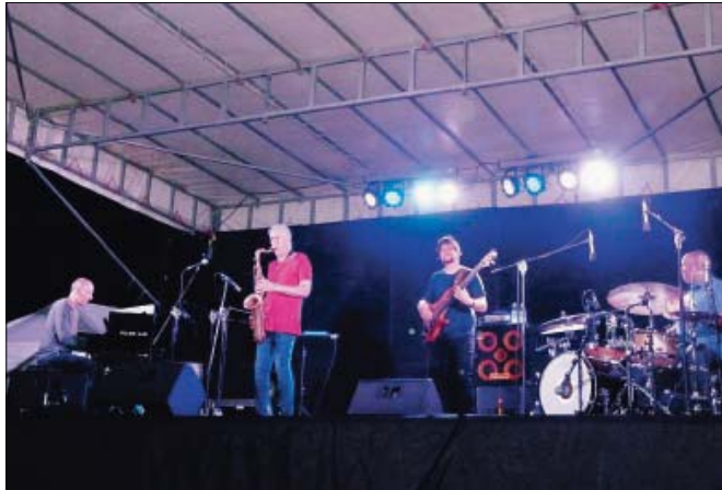
I "mitici" Yellowjackets sul palco del Pontile di Santa Maria Maddalena

Instancabili, inossidabili, i quattro Yellowjackets suonano come se non ci fosse un domani e si trascinano dietro il pubblico. Infaticabili, sempre eleganti, vanno avanti compatti come fossero un solo uomo, quadratissimi eppure lisci, oltretutto sull'ostico terreno di composizioni che