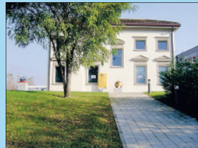
La biblioteca civica "ex macello" di Porto Viro