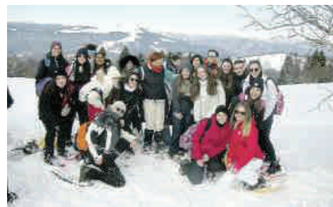
ESCURSIONE I ragazzi del Primo Levi nella gita sul Monte Grappa