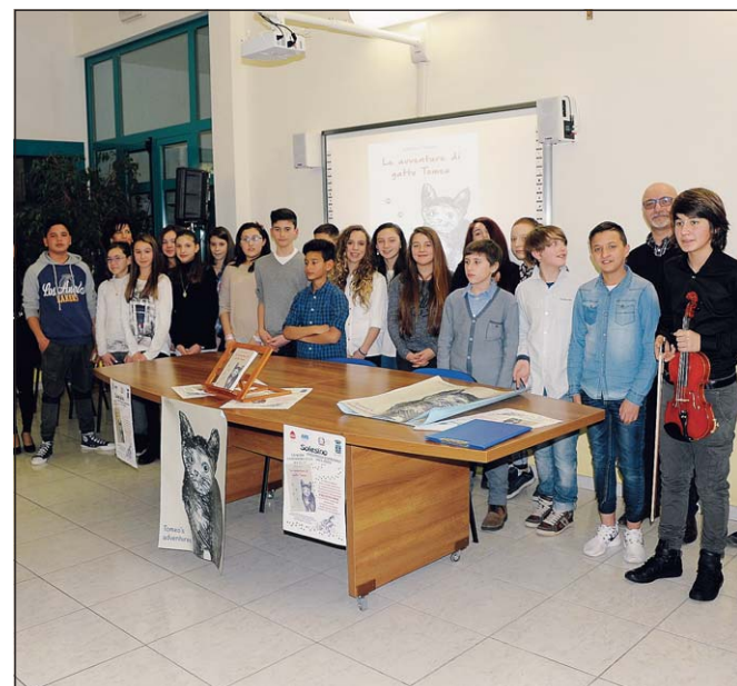
Gli studenti protagonisti della bella iniziativa