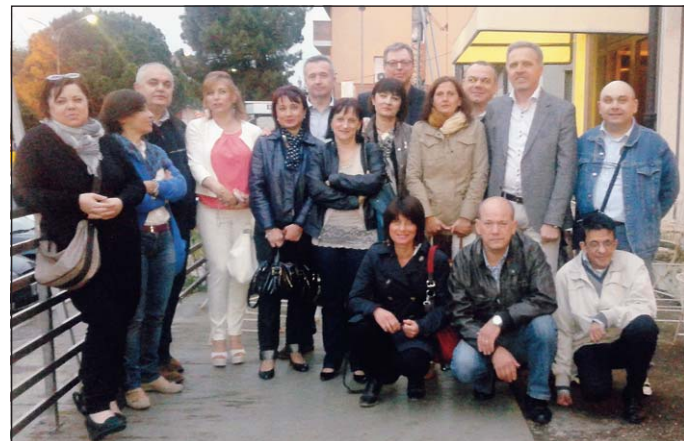
I partecipanti alla rimpatriata in pizzeria

ROVIGO - Si sono ritrovati venerdì scorso alla pizzeria Pinocchio di Rovigo, i "ragazzi" della classe 1963 che hanno frequentato la ragioneria.