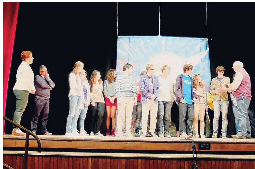
Premio del pubblico I ragazzi del laboratorio teatrale del liceo scientifico rodigino "Paleocapa" sono stati scelti dagli spettatori

La consegna dei riconoscimenti ha avuto luogo l'altra sera, al teatro Don Bosco, ad opera di Severino Zennaro, promotore dell'iniziativa, in collaborazione con don Ma-