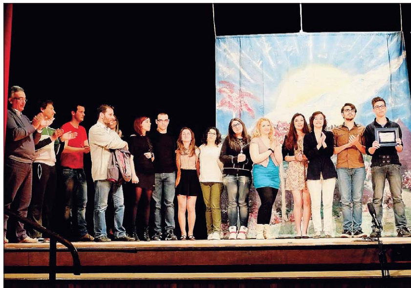
Miglior progetto educativo I ragazzi dell'istituto superiore rodigino "Celio-Roccati" hanno ritirato il premio

degli altri gruppi, per imparare gli uni dagli altri, per migliorare il proprio stile e modo di recitare. Un bonus per i giovani che sono stati presenti a tutte le recite tenute. La serata è stata arricchita, in apertura, dalla presentazione dello spettacolo Salt Lake city a cura del TeatroNexus, opera meritevole di menzione speciale per il progetto didattico ed educativo che vi è racchiuso.